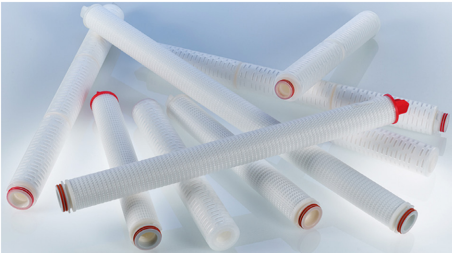
Beco Vorfilterkerzen und Beco-Membranfilterkerzen von Eaton können optimal für das gewünschte Filtrationsziel kombiniert werden.